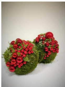
Eine Idee zum selber machen

Mitnehmen für die Mooskugeln: Moos, ev. Styroporkugeln verschiedene Grösse oder Zeitungspapier und Draht, kleinere Weihnachtskugeln diverse Grössen oder andere Deko. Ansonsten ist es jeder Teilnehmerin freigestellt, was sie gerne anfertigen möchte.